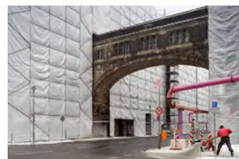
Französische Straße, 2013 Digital Print Auflage 10/2 E.A. Bildmaß 42 x 63 cm Blattmaß 50 x 70 cm Ohne Rahmen, kaschiert 480,00 € Mit Rahmen, kaschiert 530,00 €