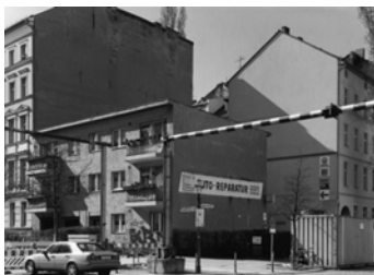
Tempelherrenstraße, Ecke Johanniterstraße, 2008 Baryt Handabzug Auflage 12 Bildmass 30 X 40 cm mit PP ohne Rahmen 750,00 €