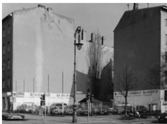
Nostitzstraße, Ecke Gneisenau- straße, 2012 Baryt Handabzug Auflage 12 Bildmass 30 X 40 cm mit PP ohne Rahmen 750,00 €