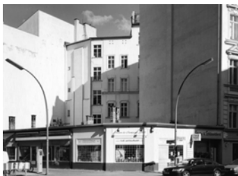
Motzstraße, Ecke Eisenacher Straße Baryt Handabzug Auflage 12 Bildmass 30 X 40 cm mit PP ohne Rahmen 750,00 €