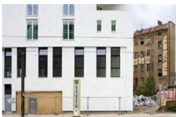
Holteistraße, 2012 Digital Print Auflage 10/2 E.A. Bildmaß 42 x 63 cm Blattmaß 50 x 70 cm Ohne Rahmen, kaschiert 480,00 € Mit Rahmen, kaschiert 530,00 €