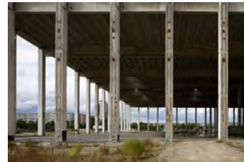
Landsberger Allee, 2011 Digital Print Auflage 10/2 E.A. Bildmaß 42 x 63 cm Blattmaß 50 x 70 cm Ohne Rahmen, kaschiert 480,00 € Mit Rahmen, kaschiert 530,00 €