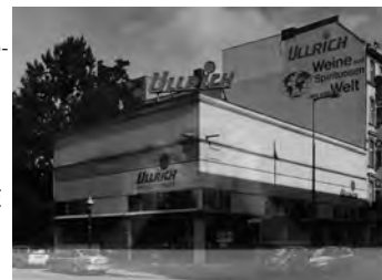
Zillestraße, Ecke Wilmersdorfer Straße, 2013, Abriß und Neube- bauung 2014 Baryt Handabzug Auflage 12 Bildmass 30 X 40 cm mit PP ohne Rahmen 750,00 €