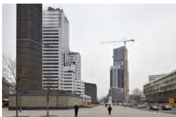
Breitscheidplatz, 2011 Digital Print Auflage 10/2 E.A. Bildmaß 42 x 63 cm Blattmaß 50 x 70 cm Ohne Rahmen, kaschiert 480,00 € Mit Rahmen, kaschiert 530,00 €