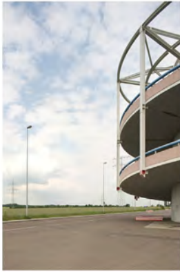
LANDSCAPE 1 2013 Digital Print Auflage 10 Bildmass 50 X 75 cm Blattmass 61,5 X 89 cm Preis ohne Rahmen 1000,00 € Preis mit Rahmen 1200,00 €