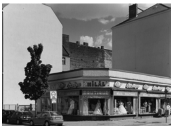
Ravenéstraße, Ecke Reinicken- dorfer Straße, 2008 Baryt Handabzug Auflage 12 Bildmass 30 X 40 cm mit PP ohne Rahmen 750,00 €