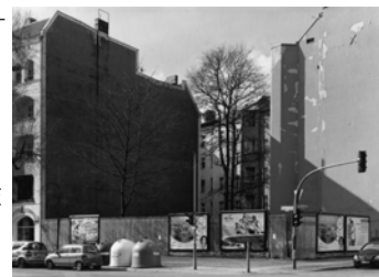
Suarezstraße, Ecke Steifensand- straße, 2008, Neubebauung 2014 Baryt Handabzug Auflage 12 Bildmass 30 X 40 cm mit PP ohne Rahmen 750,00 €