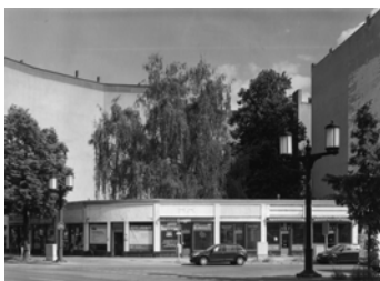
Kaiserdamm, Ecke Witzle- benstraße, 2012, alle Läden entmietet 2014 Baryt Handabzug Auflage 12 Bildmass 30 X 40 cm mit PP ohne Rahmen 750,00 €