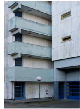
BUILDING 2 2013 Digital Print Auflage 10 Bildmass 50 X 75 cm Blattmass 61,5 X 89 cm Preis ohne Rahmen 1000,00 € Preis mit Rahmen 1200,00 €