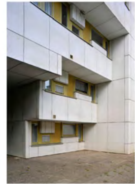
BUILDING 1 2011 Digital Print Auflage 20 Bildmass 50 X 75 cm Blattmass 61,5 X 89 cm Preis ohne Rahmen 1000,00 € Preis mit Rahmen 1200,00 €