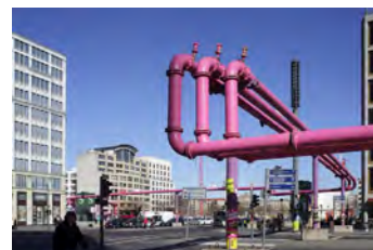
Leipziger Platz, 2012 Digital Print Auflage 10/2 E.A. Bildmaß 42 x 63 cm Blattmaß 50 x 70 cm Ohne Rahmen, kaschiert 480,00 € Mit Rahmen, kaschiert 530,00 €