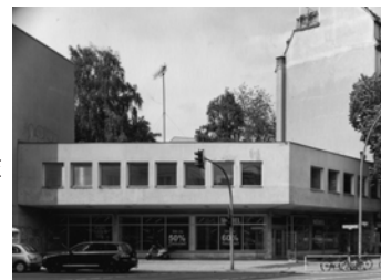
Wilmersdorfer Straße, Ecke Bismarckstraße, 2011 Baryt Handabzug Auflage 12 Bildmass 30 X 40 cm mit PP ohne Rahmen 750,00 €