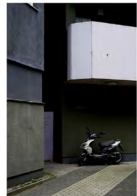
BUILDING 3 2013 Digital Print Auflage 10 Bildmass 50 X 75 cm Blattmass 61,5 X 89 cm Preis ohne Rahmen 1000,00 € Preis mit Rahmen 1200,00 €