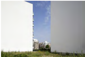
Legiendamm, 2011 Digital Print Auflage 10/2 E.A. Bildmaß 42 x 63 cm Blattmaß 50 x 70 cm Ohne Rahmen, kaschiert 480,00 € Mit Rahmen, kaschiert 530,00 €