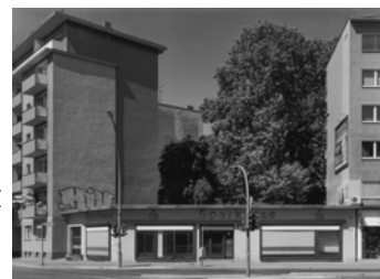
Hohenzollerndamm, Ecke Umlandstraße, 2012, Abriß und Neubebauung 2014 Baryt Handabzug Auflage 12 Bildmass 30 X 40 cm mit PP ohne Rahmen 750,00 €