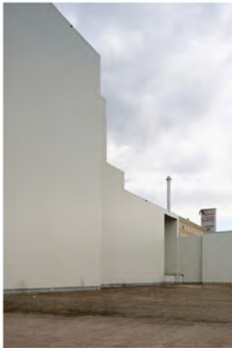
LANDSCAPE 2 2013 Digital Print Auflage 10 Bildmass 50 X 75 cm Blattmass 61,5 X 89 cm Preis ohne Rahmen 1000,00 € Preis mit Rahmen 1200,00 €