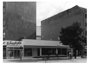
Wilmersdorfer Straße, Ecke Goethestraße, 2013 Baryt Handabzug Auflage 12 Bildmass 30 X 40 cm mit PP ohne Rahmen 750,00 €

Zwölf Schwarzweiß Fotografien in eigenhändigen Abzügen auf Barytpapier 30x40 cm. Auflage je Motiv auf 12 Abzüge (gleich welcher Größe) limitiert. Je Abzug wie ausgestellt in Passepartout (Museumskarton) ohne Rahmen 750,-, der Gesamtblock mit allen zwölf Fotografien 8000,- Euro.