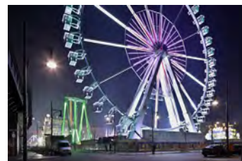
Dircksenstrasse, 2011 Digital Print Auflage 10/2 E.A. Bildmaß 42 x 63 cm Blattmaß 50 x 70 cm Ohne Rahmen, kaschiert 480,00 € Mit Rahmen, kaschiert 530,00 €