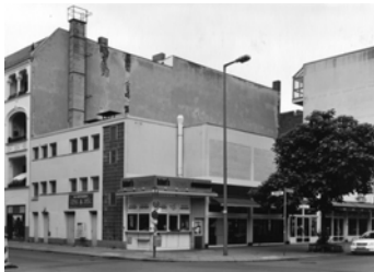
Zillestraße, Ecke Wilmersdorfer Straße, 2013 Baryt Handabzug Auflage 12 Bildmass 30 X 40 cm mit PP ohne Rahmen 750,00 €