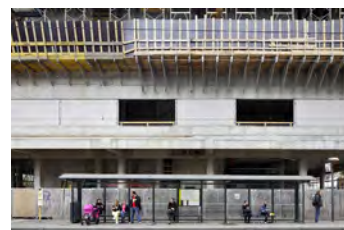
Gontardstraße, 2013 Digital Print Auflage 10/2 E.A. Bildmaß 42 x 63 cm Blattmaß 50 x 70 cm Ohne Rahmen, kaschiert 480,00 € Mit Rahmen, kaschiert 530,00 €