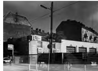
Greinerstraße, Mariendorf, 2012 Baryt Handabzug Auflage 12 Bildmass 30 X 40 cm mit PP ohne Rahmen 750,00 €