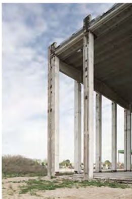
LANDSCAPE 3 2012 Digital Print Auflage 10 Bildmass 50 X 75 cm Blattmass 61,5 X 89 cm Preis ohne Rahmen 1000,00 € Preis mit Rahmen 1200,00 €